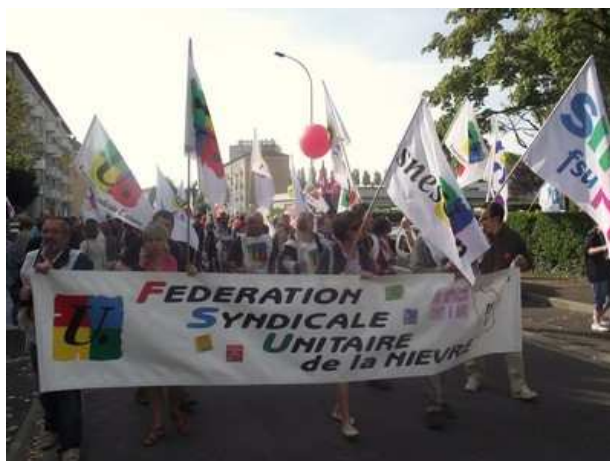
A Nevers, départ de la manifestation place Carnot à 14h30.

Pour dénoncer ces mesures inacceptables et peser sur les choix du gouvernement, la FSU, avec tous les syndicats de la Fonction publique dans une unité syndicale inédite, appelle les agents à se mettre en grève et à manifester massivement le 10 octobre.